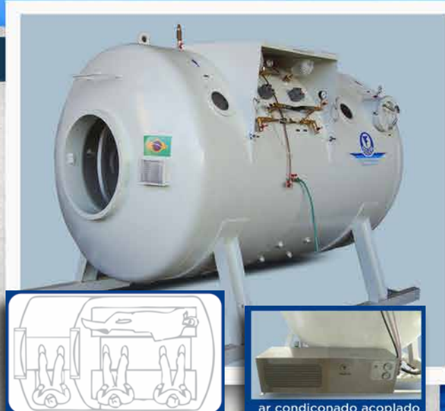
ar condicionado acoplado

ABS Consulting HYDRA CONSULTING DIVISION